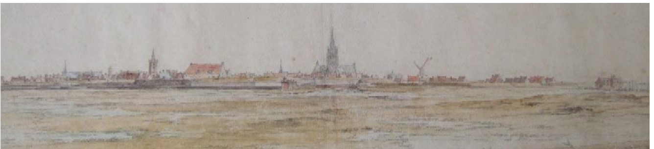
Adam Frans Van der Meulen, Vue de Gravelines , 1665, dessin aquarellé © Mobilier national