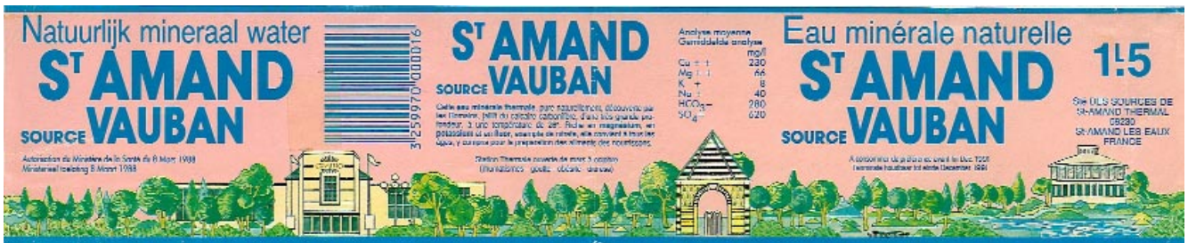
Saint Amand source Vauban, étiquette de bouteille © Philippe Bragard