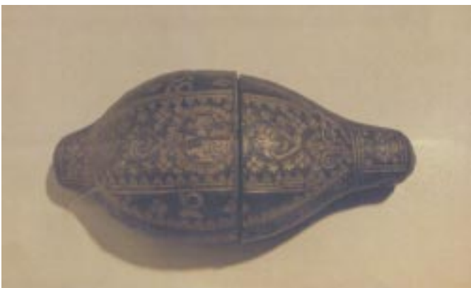
Étui à couverts pliants en cuir gaufré doré avec inscription et datation 1639