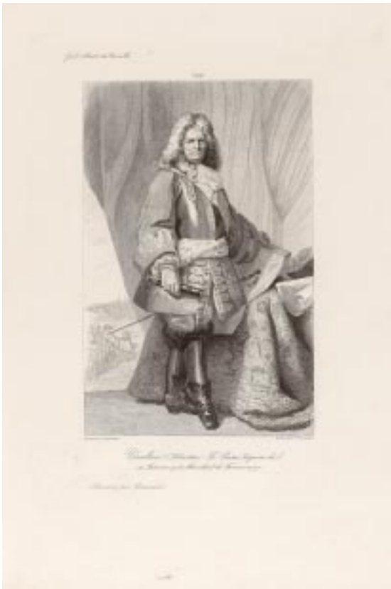
François, Sébastien Le Prestre, Seigneur de Vauban, héliogravure, d'après le dessin de Girardet