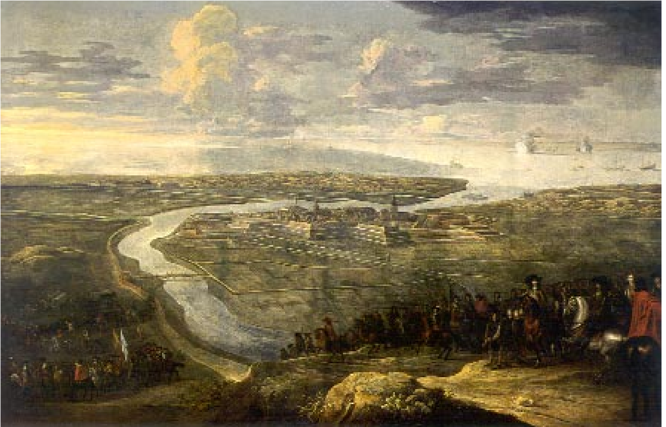
Lambert De Hondt, Léopold Guillaume héros de Gravelines , 1652, huile sur toile

Chaque image doit obligatoirement être publiée avec sa mention.